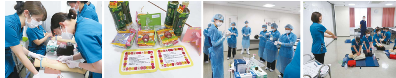
茶話会のメッセージカード